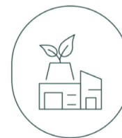
LES IMMEUBLES LIFA

pôles d'action sont au coeur du plan ESG Lifa