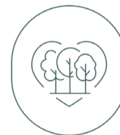
LA COMMUNAUTÉ LIFA